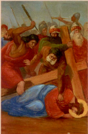
VII.: Ježíš padá pod křížem podruhé.