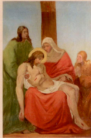
XIII.: Ježíš spočívá na klíně své matky.