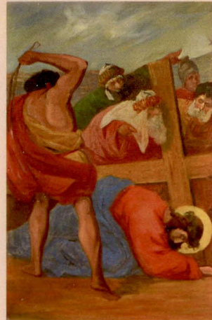
IX.: Ježíš padá pod křížem potřetí.