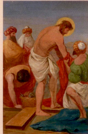
X.: Z těla Ježíše strhávají šat.