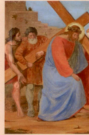
V.: Šimon z Cyreny pomáhá Ježíši nést kříž.