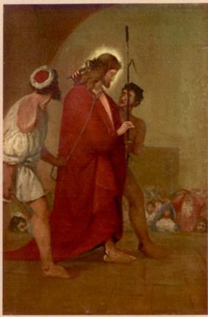
I.: Ježíš se dal odsoudit na smrt.