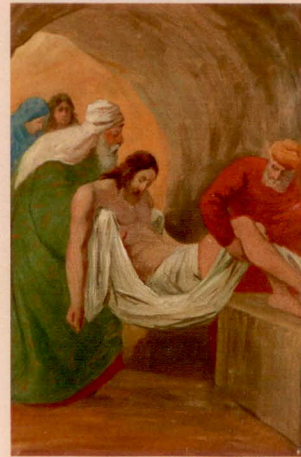
XIV.: Tělo Ježíše odpočívá v hrobě.

Uprkova křížová cesta je v jistém smyslu klasická křížová cesta, ale zároveň je originální způsobem autora vidění, které provokuje k přemýšlení. Pro mnohé tváře nacházel inspiraci ve svých současníkch. Jednotlivá zastavení vedou k meditaci a snad také k probuzení nové pozornosti k utrpení, s nímž se setkáváme v životě, ke snaze vidět ho nově, či jít ještě hlouběji a uvědomovat si, že v každodenním životě máme mnoho příležitostí potkat trpícího Krista, objevit jeho tvář třeba v lidech nemocných a trpících, nebo i v těch nepříjemných či dokonce zlých. Krista, který na sebe vzal hříchy světa, je opravdu možné objevit v převleku za naše současníky. Porozumění křížové cestě vede k novým postojům vůči lidem v našem okolí. Odhalení jeho tváře i v těch, které není snadné mít rád, umožní milovat Krista v nich, když není možné milovat je pro jejich chyby. Přeji všem návštěvníkům výstavy nejen umělecký zážitek, ale i duchovní užitek s praktickým dopadem na kulturu běžného života.