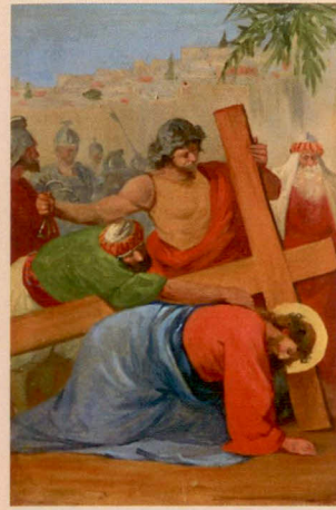
III.: Ježíš poprvé padá pod tíhou kříže