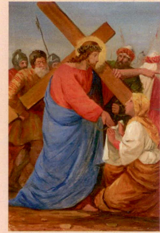
VI.: Veronika podává Ježíši roušku.