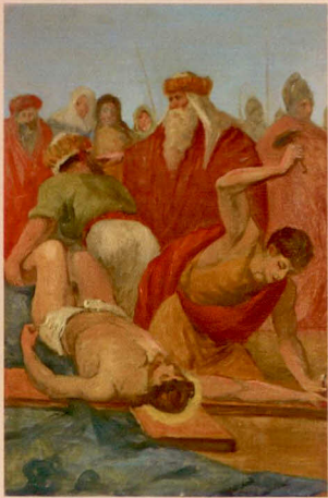
XI.: Ježíše přibíjejí na kříž.