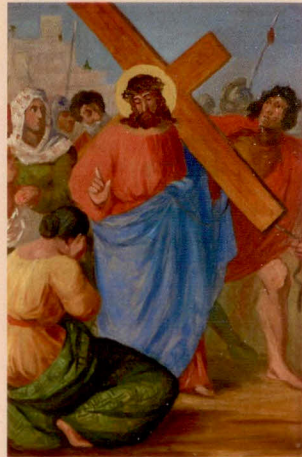
VIII.: Ježíš napomíná plačící ženy.