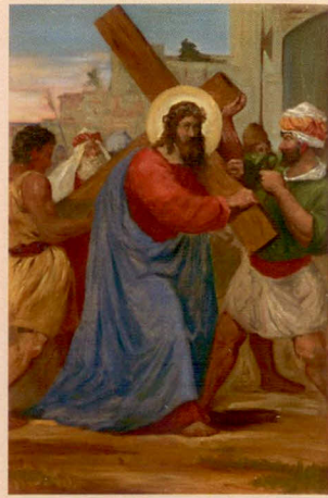
II.: Ježíš bere na sebe kříž.