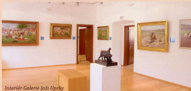
Interiér Galerie Joži Uprky