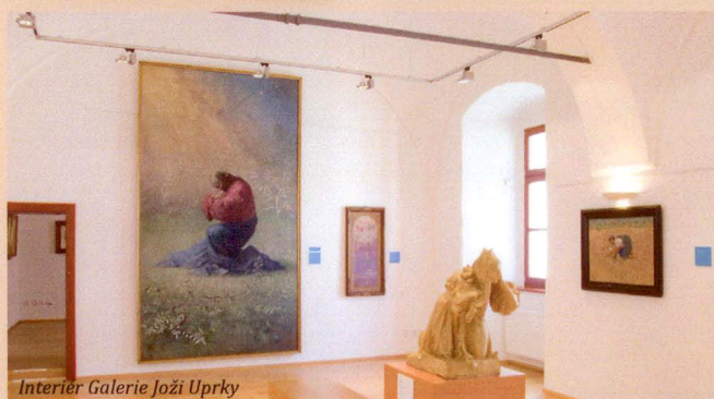
Interiér Galerie Joži Uprky