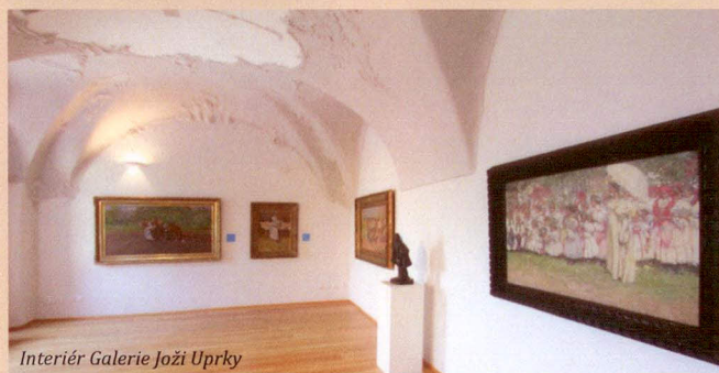
Interiér Galerie Joži Uprky